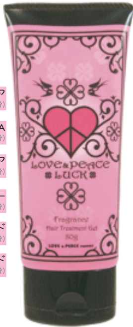
ヘアトリートメントジェル